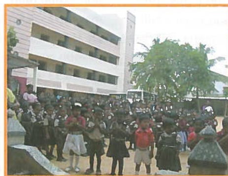
▲ Construction de ce bâtiment St Antony 's School suite au tsunami (sud de Madras)

L'Inde concentre 20% du total mondial des cas de tuberculose. Avec 14 millions d'habitants dont la moitié vit dans