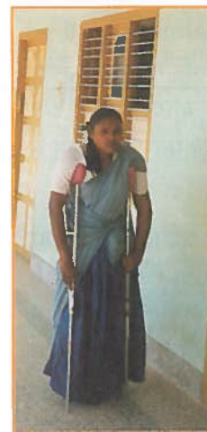
▲ La rééducation sur place est importante après l'intervention chirurgicale.

Il a été construit en 1995. Plus d'une centaine d'enfants atteints de séquelles