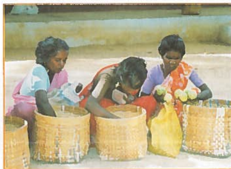
▲ Ferme de Manamadurai. Récolte et vente de fruits

Cette ferme permet aujourd'hui de donner du travail et de nourrir des centaines de familles des environs et demeure un modèle, avec des moyens modernes d'irrigation, des puits, des pompes. Le riz, les arachides, les piments, les pom-