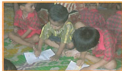
▲ Animation éducative en plein coeur des bidonvilles.

Notre but est double : d'une part traiter les malades de la tuberculose en lien avec les structures de santé publique indienne qui fournissent gratuitement les médicaments, d'autre part apporter un accompagnement individuel aux familles les plus pauvres des bidonvil-